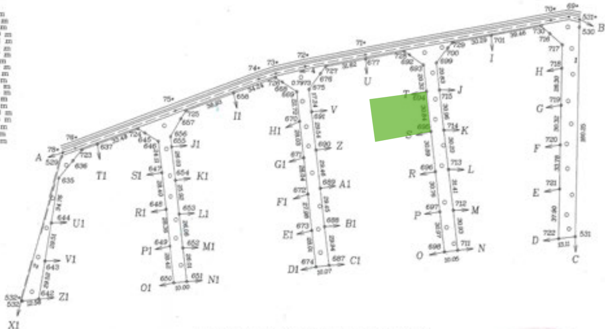
Zemes izvietojuma shēma